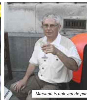
Marvano is ook van de partij