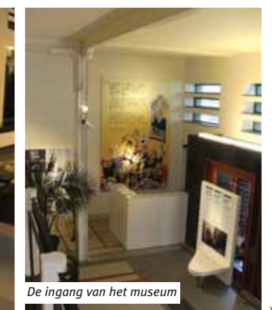
De ingang van het museum