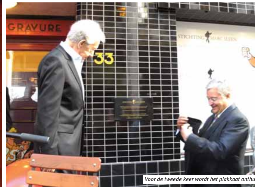
Voor de tweede keer wordt het plakkaat onthult