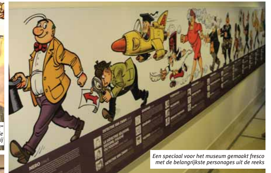
Een speciaal voor het museum gemaakt fresco met de belangrijkste personages uit de reeks