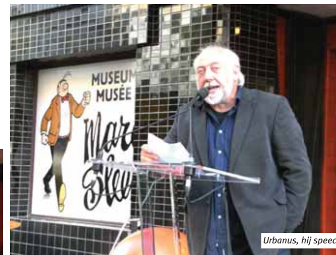
Urbanus, hij spreekt