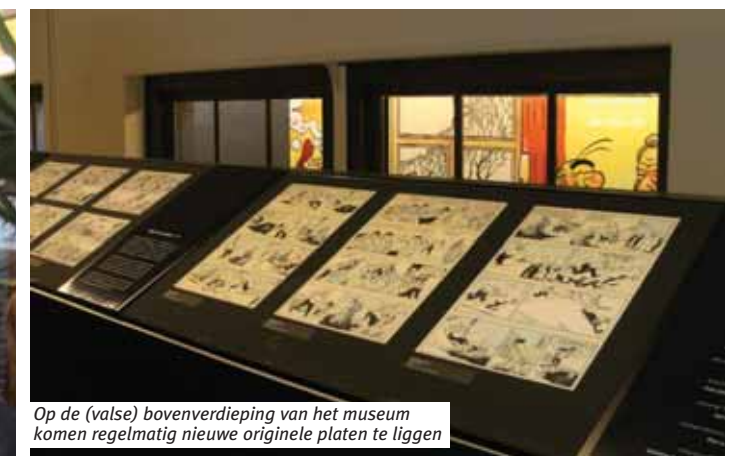
Op de (valse) bovenverdieping van het museum komen regelmatig nieuwe originele platen te liggen