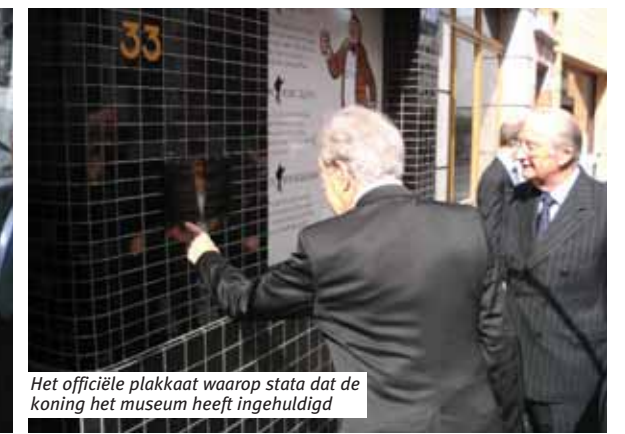
Het officiële plakkaat waarop staat dat de koning het museum heeft ingehuldigd