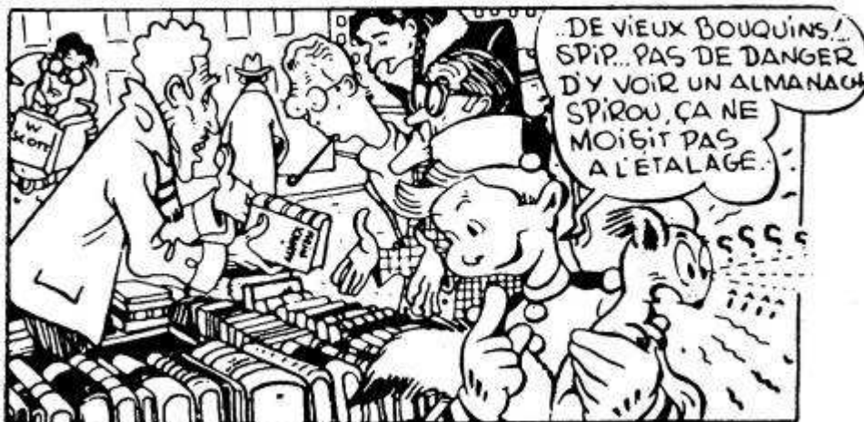
Jijé, Robbedoes – La Jeep, Dupuis Uitgeverij

Het is dankzij de goede raad van de uitgever Charles Dupuis, dat Morris en Franquin Jijé leren kennen. Samen zullen de vier tekenaars dan actief meewerken aan het opstarten van het stripblad Robbedoes. Begin 1947, deelt het viertal liefde en leed in het Gillain familiehuis te Waterloo. Ze veroorloven zich daarbuiten wel tramritten naar de Oude Markt van Brussel en zelfs weekend-uitstapjes naar de Ardennen. De vier avonturiers vertrokken dan met de familiewagen en een aanhangwagen van het Amerikaanse leger erachteraan.