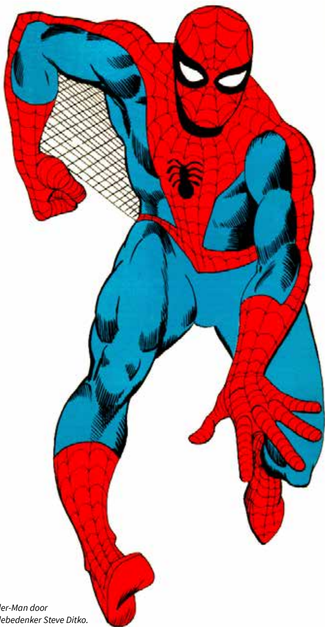
Spider-Man door medebedenker Steve Ditko.