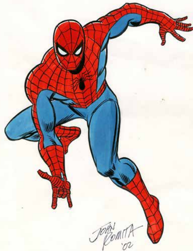
Spider-Man door John Romita.

Op 7 juni presenteerde hij zijn boek MIJN VRIEND SPIDER-MAN: SUPERHELDEN, GEEKS EN FAN CULTUUR. Vooruitlopend hierop gaf hij een interview aan Stripspecialzaak.be.