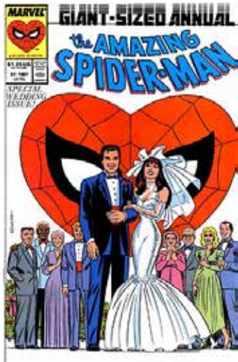
Peter Parker en Mary Jane trouwen! Maar het huwelijk verdween later uit Peters leven door een deal met de duivel om zijn tante May het leven te redden.

hij zich niet voorstellen dat Peter en Mary Jane zouden scheiden en dat ze hun liefde zouden opgeven. Volgens Quesada is een scheiding iets uit de werkelijkheid, waar veel lezers mee te maken krijgen, terwijl de deal met de duivel het toch meer op het terrein van magie houdt. Dat vond hij beter. Zelf vind ik Mary Jane ook een fijn personage en het zou eeuwig zonde zijn geweest als ze aan haar einde was gekomen. Van mij had het hele huwelijk niet gewist hoeven te worden want een reset (retcon) van een Marvel-serie heeft zelfden het gewenste resultaat. Kijk maar naar het verhaal rondom de Kloon Saga. Maar een vrij-