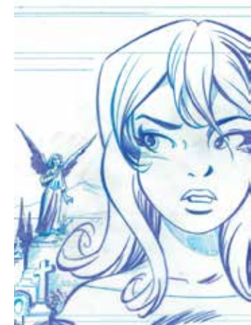
Cover van FANNY K. 1 en de ontwerpcover van deel 2, MORPHEUS. Op elk van de drie covers van de eerste driedelige cyclus zal Fanny een andere kant op kijken.